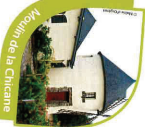
Moulin de la Chicane