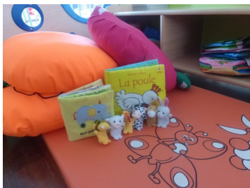
Bébés-lecteurs (une séance par mois)